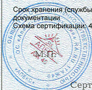
Схема сертификации: 4

Срок хранения (службы, годности) указан в прилагаемой к продукции товаросопроводительной и/или эксплуатационной документации